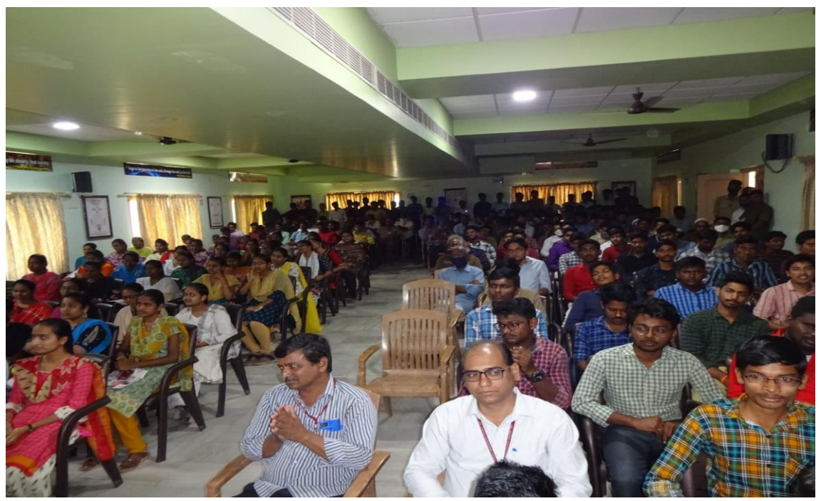
HOD of AS&H and other staff along with student volunteers in the program