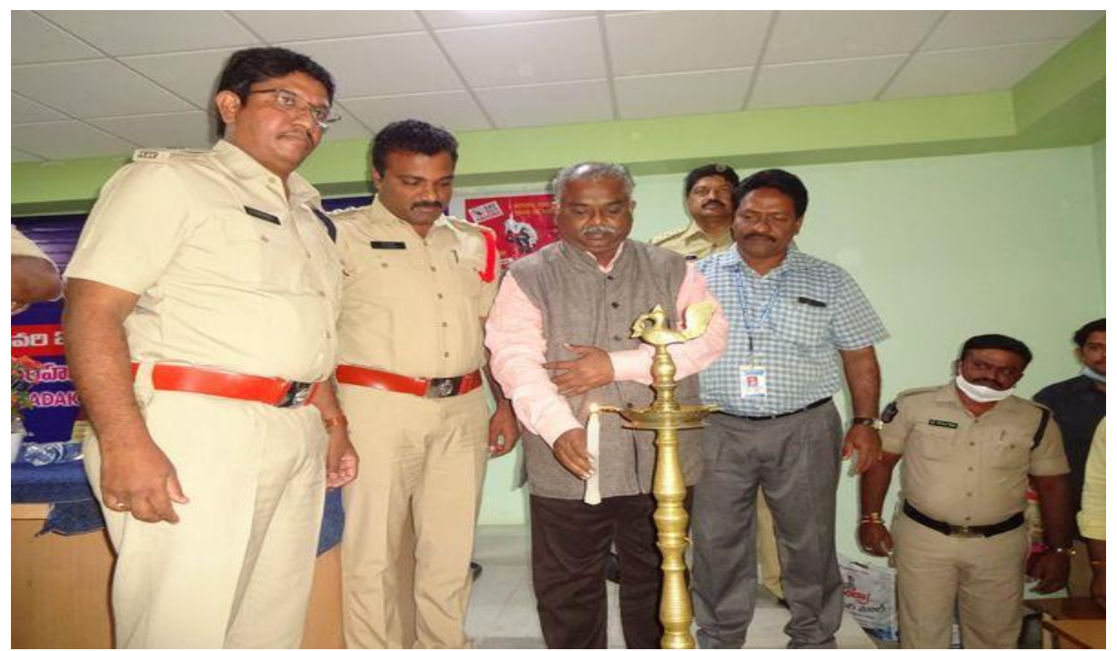
Lightning of the lamp by delegates and police officials on the road safety program