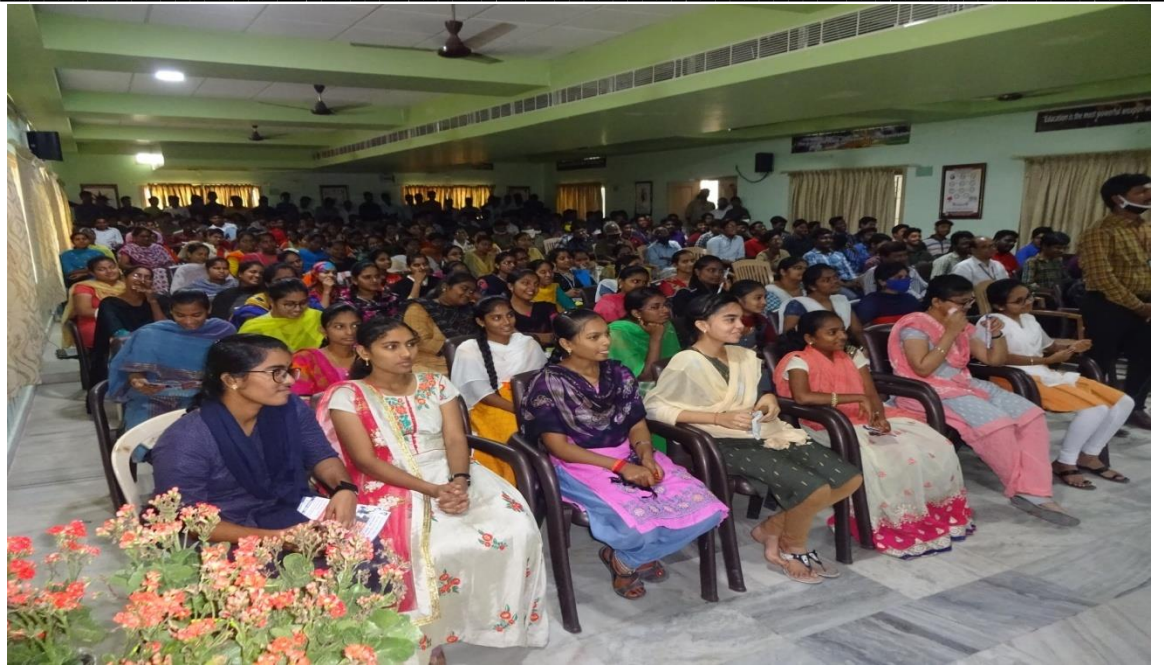
Participation of students and staff members in the road safety program